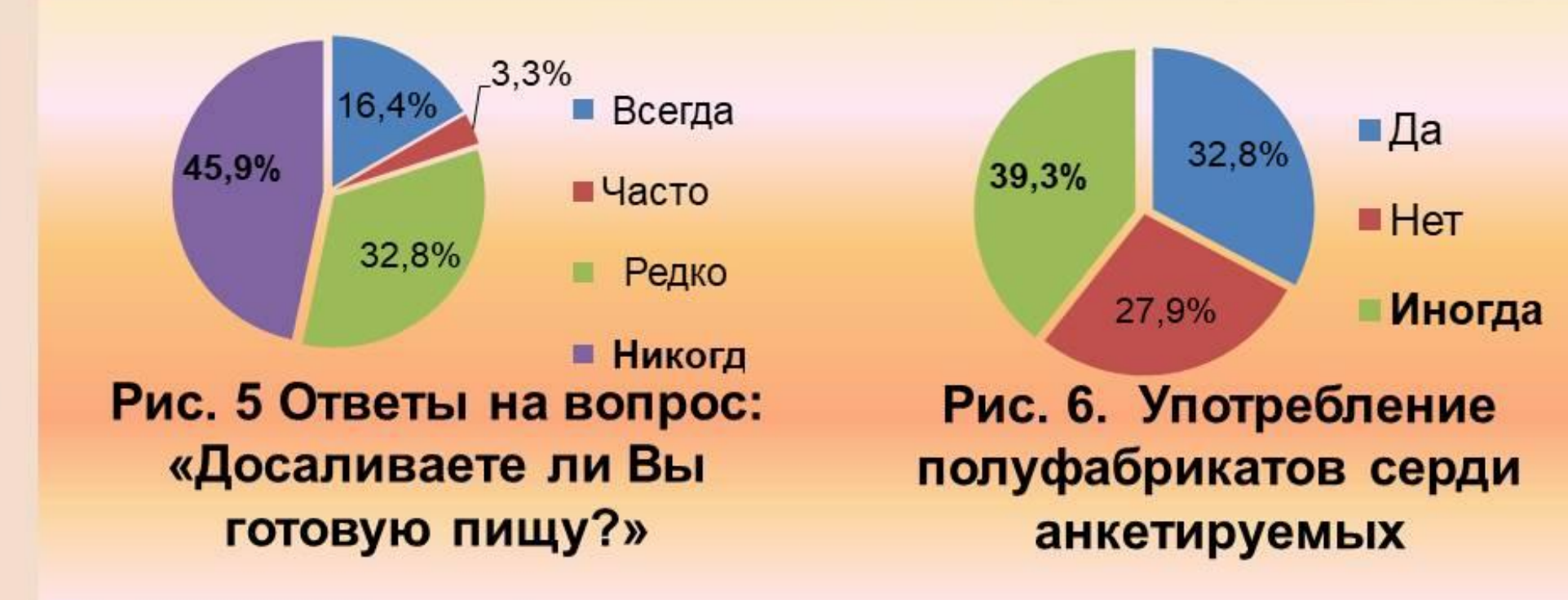
Рис. 5 Ответы на вопрос: «Досаливаете ли Вы готовую пищу?»

Лишь четверть респондентов не употребляет полуфабрикаты, в то время как все остальные это делают (рис. 6).