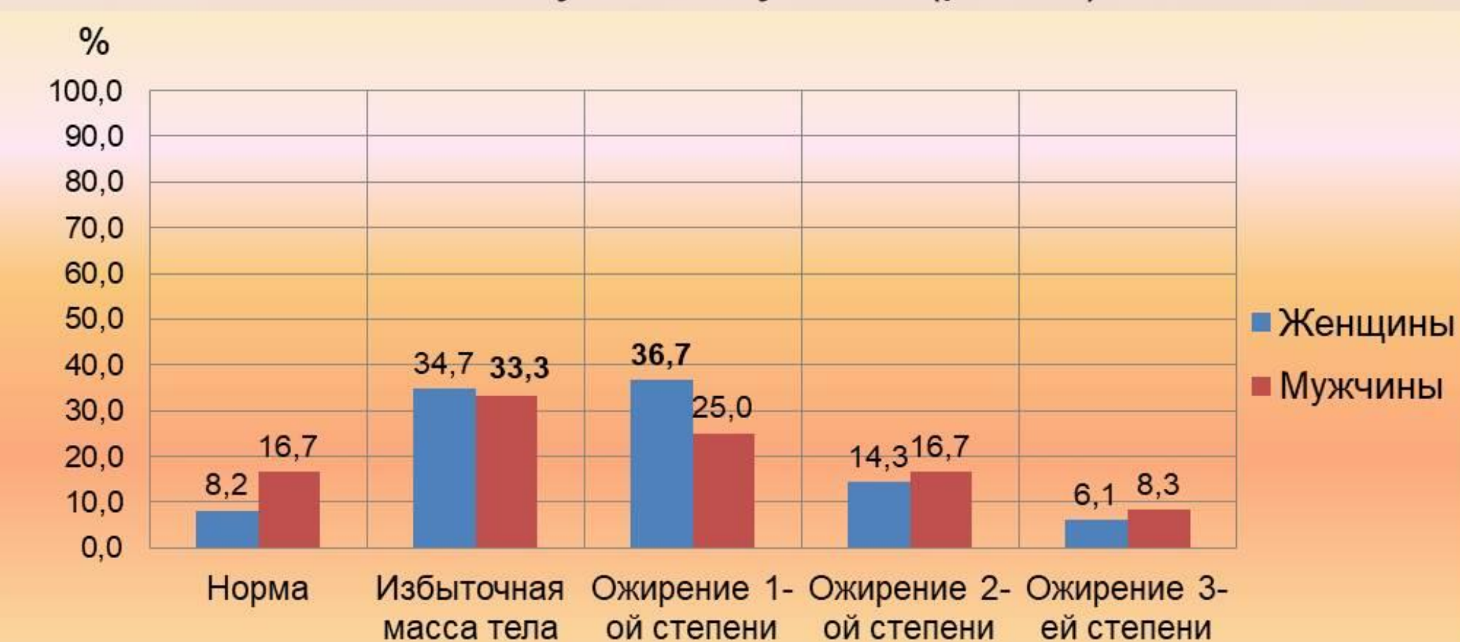
Рисунок 2. Индекс массы тела респондентов

У женщин с АГ преимущественно наблюдается ожирение 1-ой степени, а мужчины в большинстве случаев имеют избыточную массу тела (рис. 2).