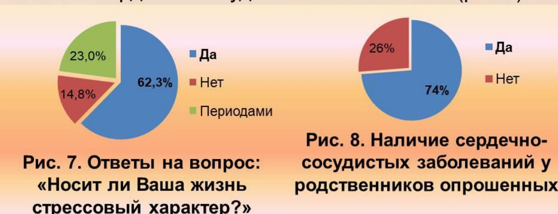
Рис. 7. Ответы на вопрос: «Носит ли Ваша жизнь стрессовый характер?»

Почти 3/4 опрошенных указали, что у родственников были сердечно-сосудистые заболевания (рис.8).