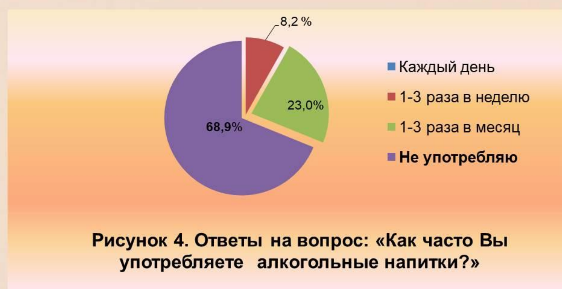
Рисунок 4. Ответы на вопрос: «Как часто Вы употребляете алкогольные напитки?»

Большее количество респондентов с АГ утверждали, что не употребляют алкогольные напитки (рис. 4.)