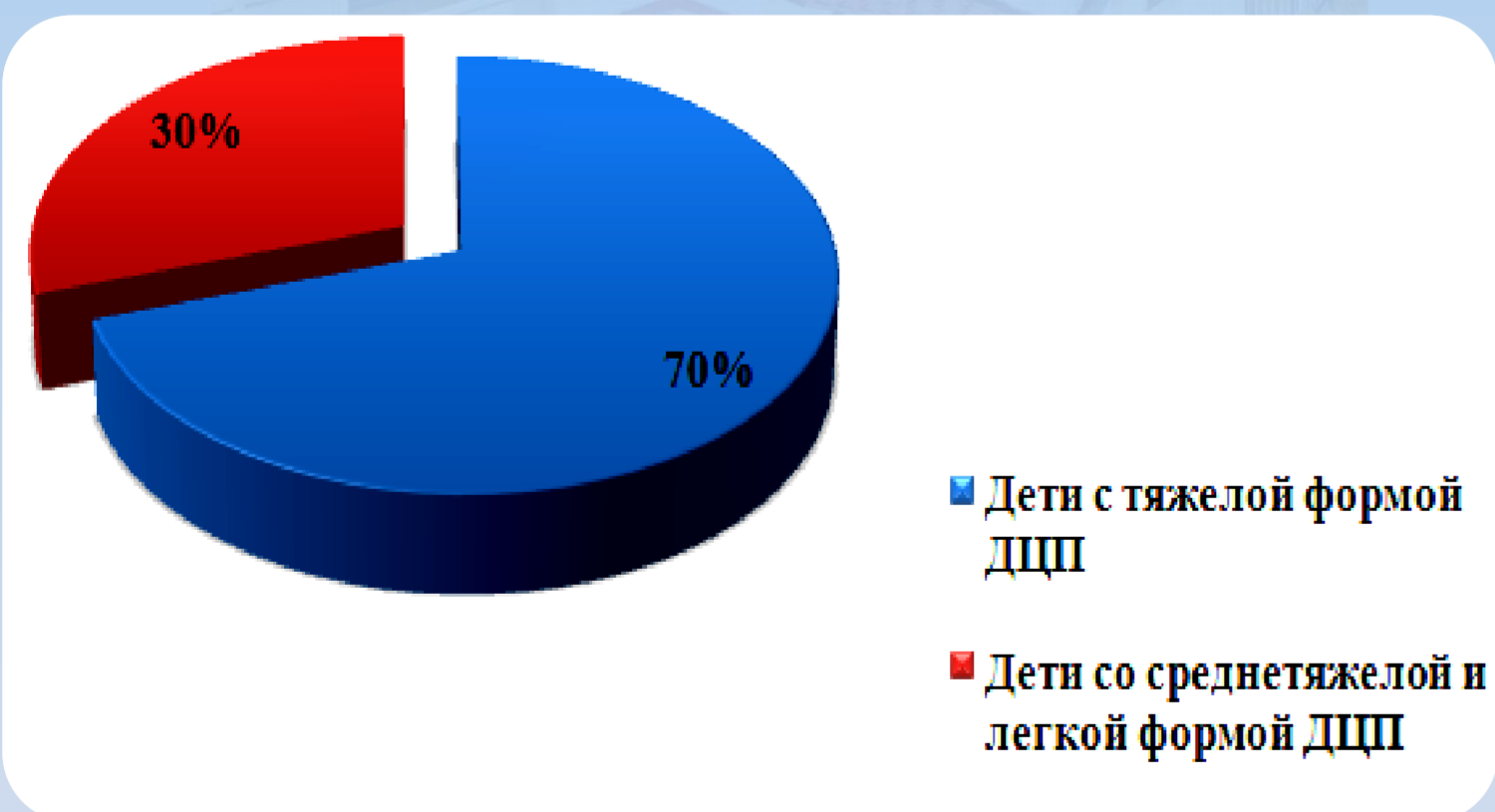
Рис.1. Распределение детей по степени тяжести ДЦП

За 2019 год в Тюменском филиале Центра получили курсы реабилитации 400 детей с ДЦП. Нами было проведено анкетирование 30 родителей детей с ДЦП (7,5%).