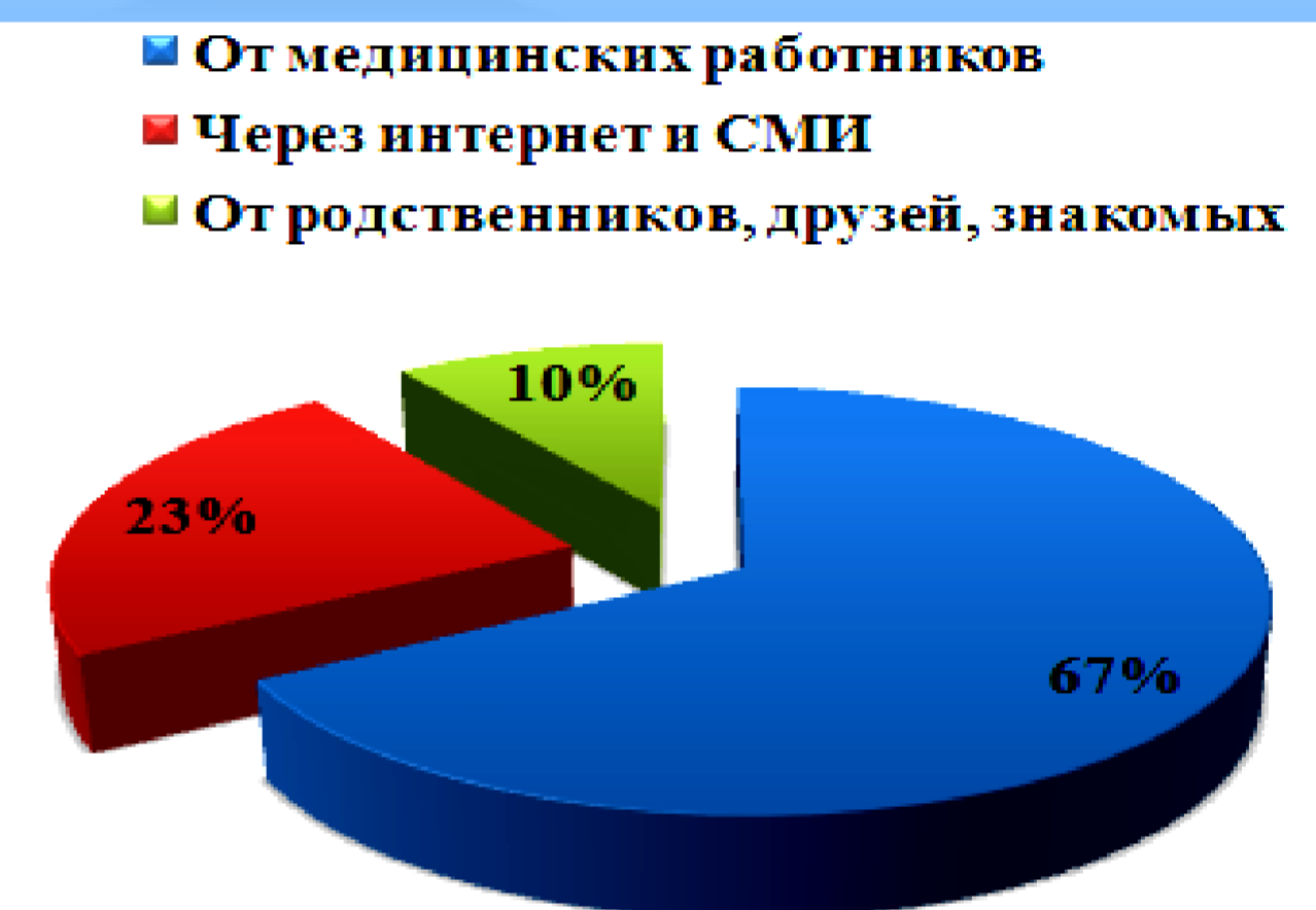
Рис.4. Ответы респондентов на вопрос: «От кого вы узнали о необходимости постоянной реабилитации?»

100% родителей указали на необходимость занятий с ребенком в домашних условиях, но лишь 83 % утверждали, что занимаются: самостоятельно – 40%, в домашних условиях и в ДРЦ – 40%, только в ДРЦ – 3%.