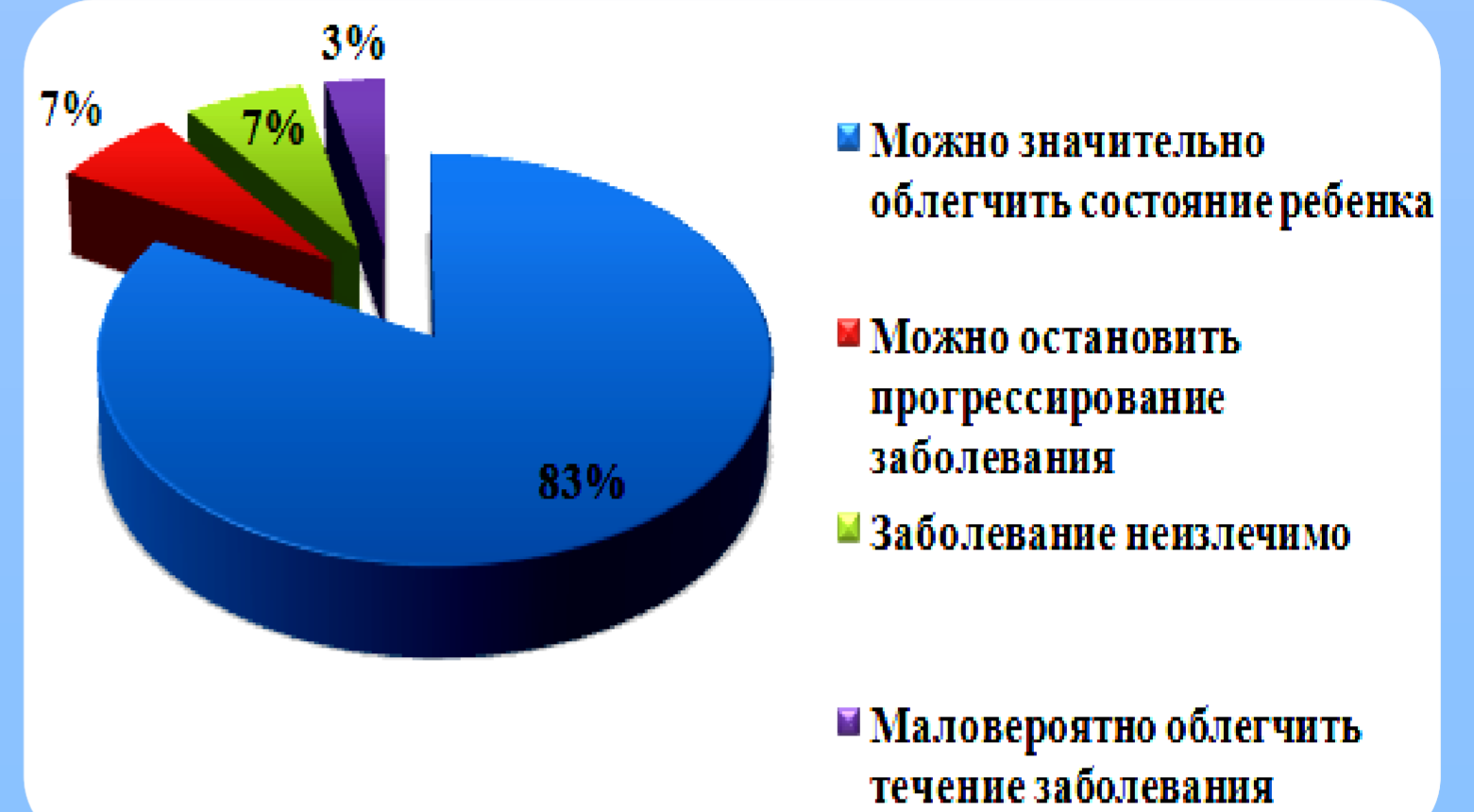
Рис.3. Ответы респондентов на вопрос: «Что вы знаете о прогнозе заболевания ДЦП?»